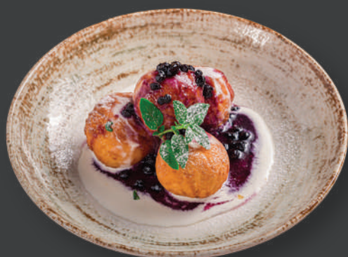
PAPANAȘI cu dulceață și smântână