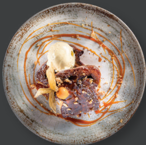
DESSERT Gustul Copilăriei